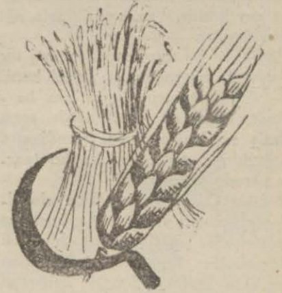
376785 kilo da mısır tohumu verilmiştir. Bu tohum ile de 100198 dekar arazi ekilecektir. (Devamı 5 inci sayfada)

Vilâyette, Adapazarı hariç olmak üzere, çiftçiye, 144699 kilo patates tohumu tevzi olunmuştur. Bu tohum ile 1766 dekar toprak ekilecektir.